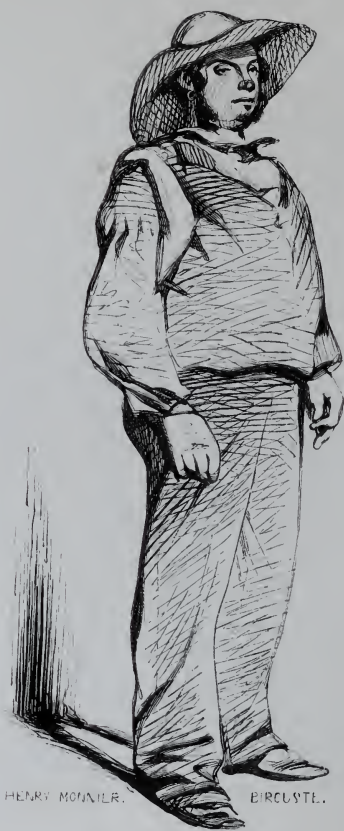
Le Fort de la halle.